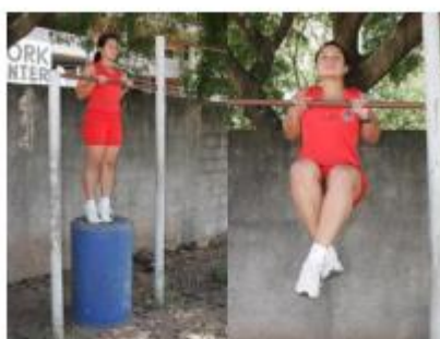
Posição inicial Execução do exercício

9.3.3. Barra estática (feminino): consiste na permanência em pegada de pronação (palmas das mãos voltadas para frente, dorsos das mãos voltados para o rosto), com o queixo ultrapassando a linha da barra, pelo maior tempo possível, em isometria, sem o auxílio de qualquer outro meio de sustentação que não sejam as mãos. Somente a partir da tomada de posição, com os braços flexionados e o queixo acima da linha superior da barra, com a cabeça na posição normal (olhando para frente) é que o cronômetro será acionado. Durante a execução, a candidata deverá manter o corpo retesado, como se houvesse uma linha reta partindo do calcanhar até o ombro e permanecer até o final do tempo exigido, para só depois retirar-se da barra, não sendo permitido balanceio, flexão dos joelhos, cruzamento das pernas, tocar o pé no solo ou qualquer parte do suporte do aparelho da barra fixa após o início do teste, não podendo apoiar o queixo na barra e nem utilizar luva(as) ou qualquer outro material para proteção das mãos, caso contrário será eliminada. O tempo de permanência será convertido em pontos conforme tabela II.